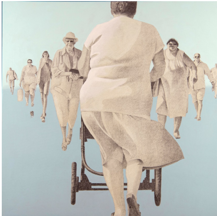
Seule contre tous, huile et crayon sur toile, 120x120, 2018