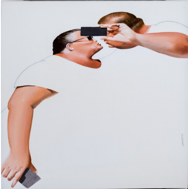
Ego-bisou, huile et crayon sur toile, 50x50, 2018