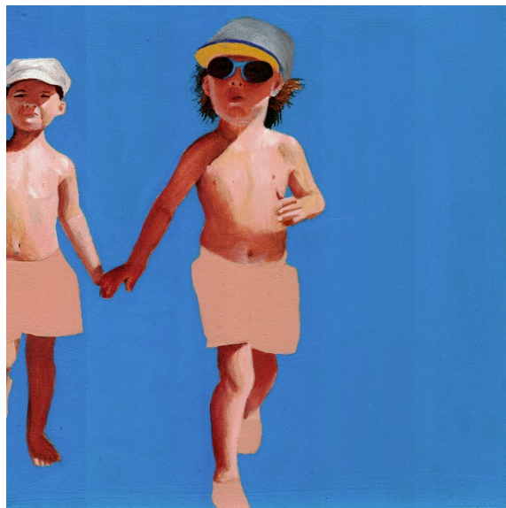
Guerrier 8, Série : Huile sur bois, 20x20, 2018