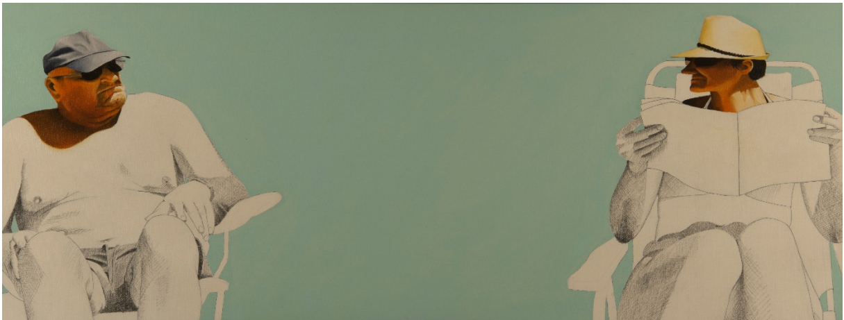
Regards croisés, huile et crayon sur toile, 50x130, 2018

Je recherche dans l'ordinaire des sujets ce qui précisément les rend uniques.