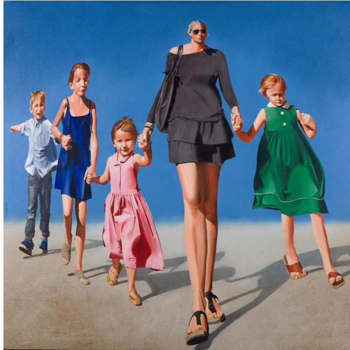
La mère de famille, huile sur toile, 120x120, 2014