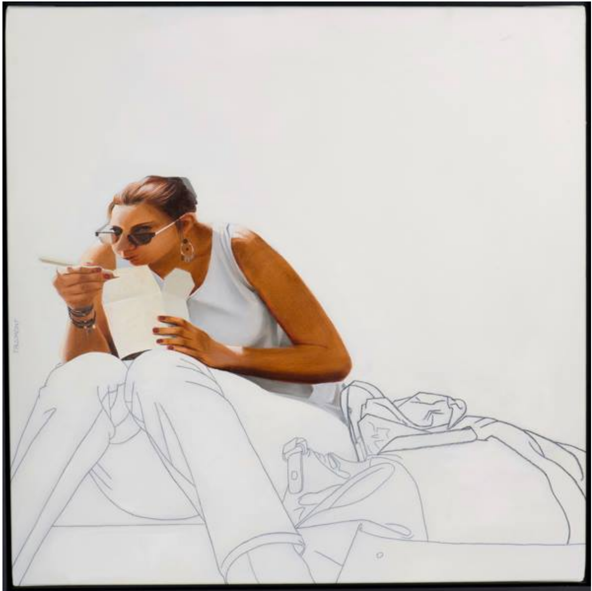
Les baguettes, huile et crayon sur toile, 80x80, 2014