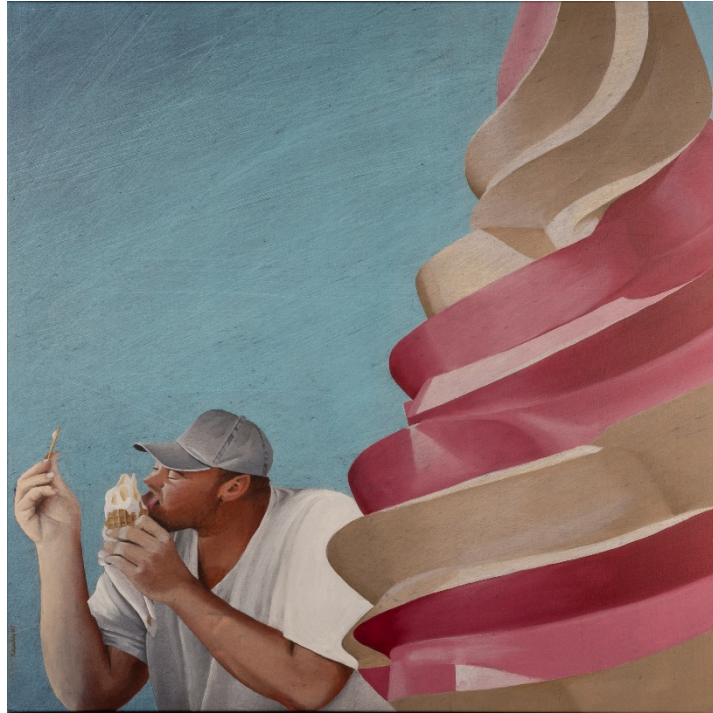
Délectation, huile sur toile, 80x80, 2015