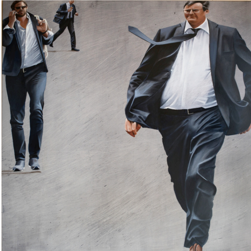
Directions, huile sur toile, 120x120, 2016