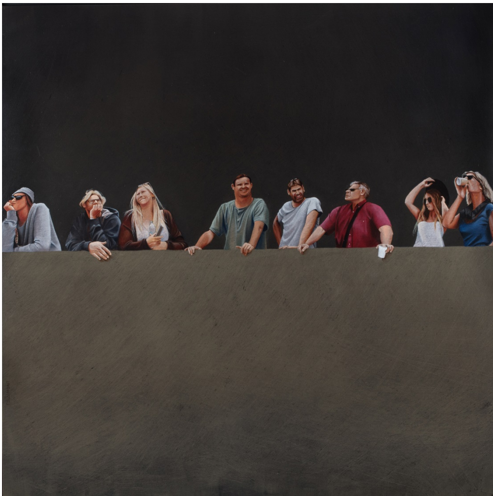
Le grand balcon, huile sur toile, 120x120, 2016

AIRIAL GALERIE, 61 rue de Galand 40200 Mimizan