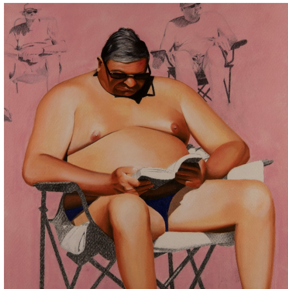
crayon sur toile, 80x80, 2018