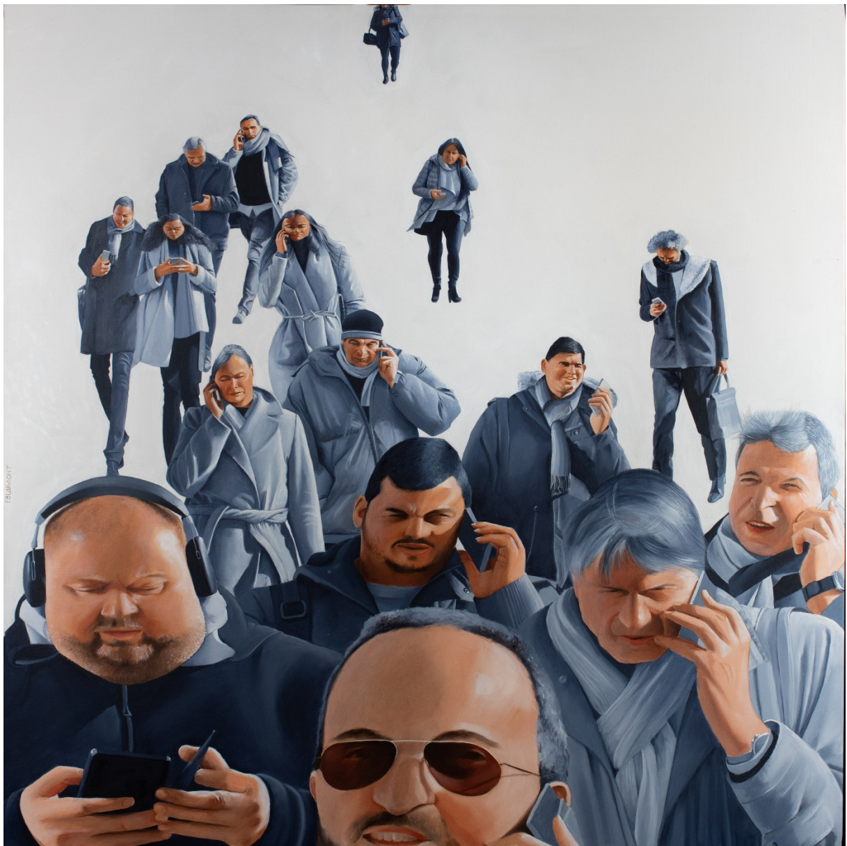
La grande rumeur, huile sur toile, 120x120, 2018