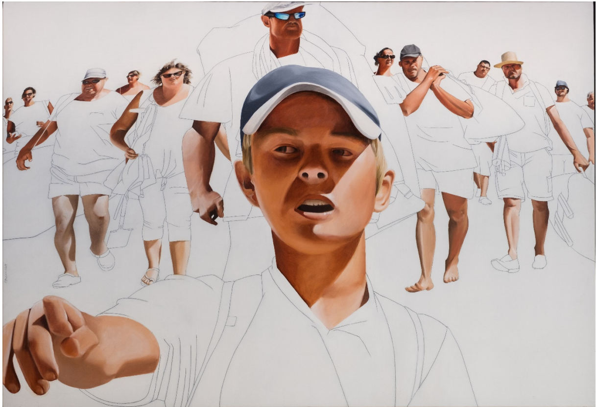
A l'attaque, huile et crayon sur toile, 80x130, 2018

ASSIEDS-TOI ET PARTAGE AVEC MOI LE SPECTACLE DE MA RUE. REGARDE EN SOURIANT DEFILER CES PASSANTS ORDINAIRES (...)