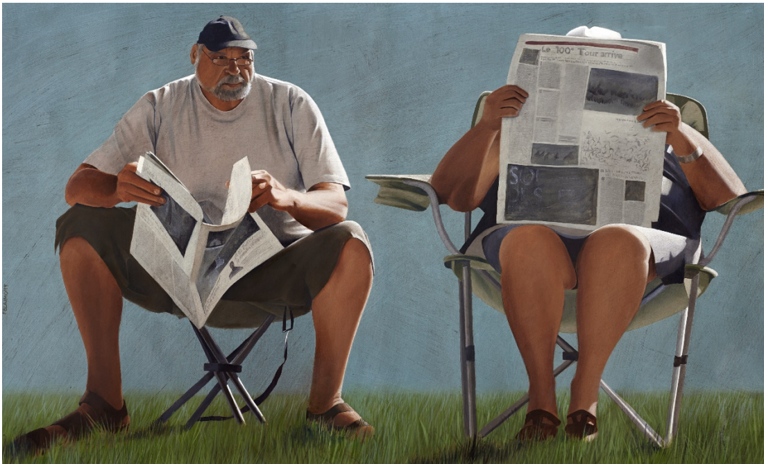
Couple avec guetteur, huile sur toile, 97x162, 2013

J'observe les gens, transparents comme l'air que nous respirons, dans leurs habitudes : ces gens qui s'aiment, ces gens qui pensent, qui bougent, qui mangent, qui se laissent aller, des gens qui sont partout mais que l'on ne regarde pas. C'est une source inépuisable de scènes de genre intimes ou anecdotiques.