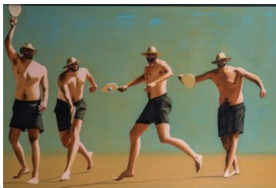
le bal de la balle, huile sur toile, 55x130, 2017

Il s'en est fallu de peu que je sois hyperréaliste, à ceci près qu'à la réalité j'ajoute mon grain de sel qui ressemble très souvent à du poil à gratter. Ma toile est un théâtre social dont je suis le metteur en scène qui renvoie à la vie quotidienne dans sa singulière banalité.