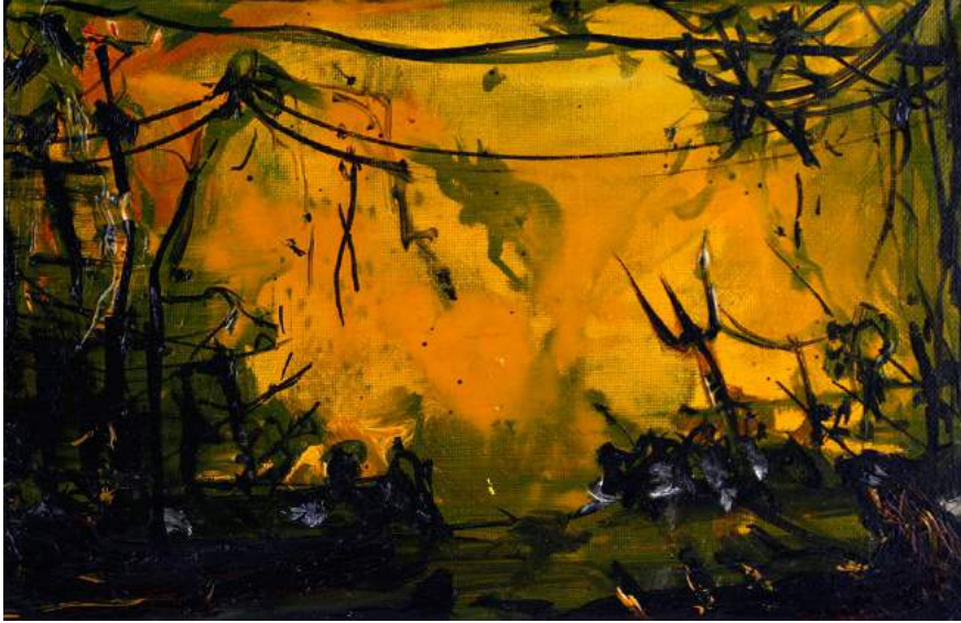
Hell, huile sur toile, 14 x 22 cm, 2015