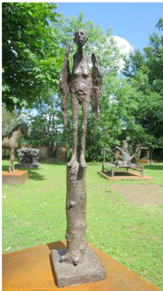
Prix décerné à la lauréate 2019 : bronze, 45 cm, sans titre.