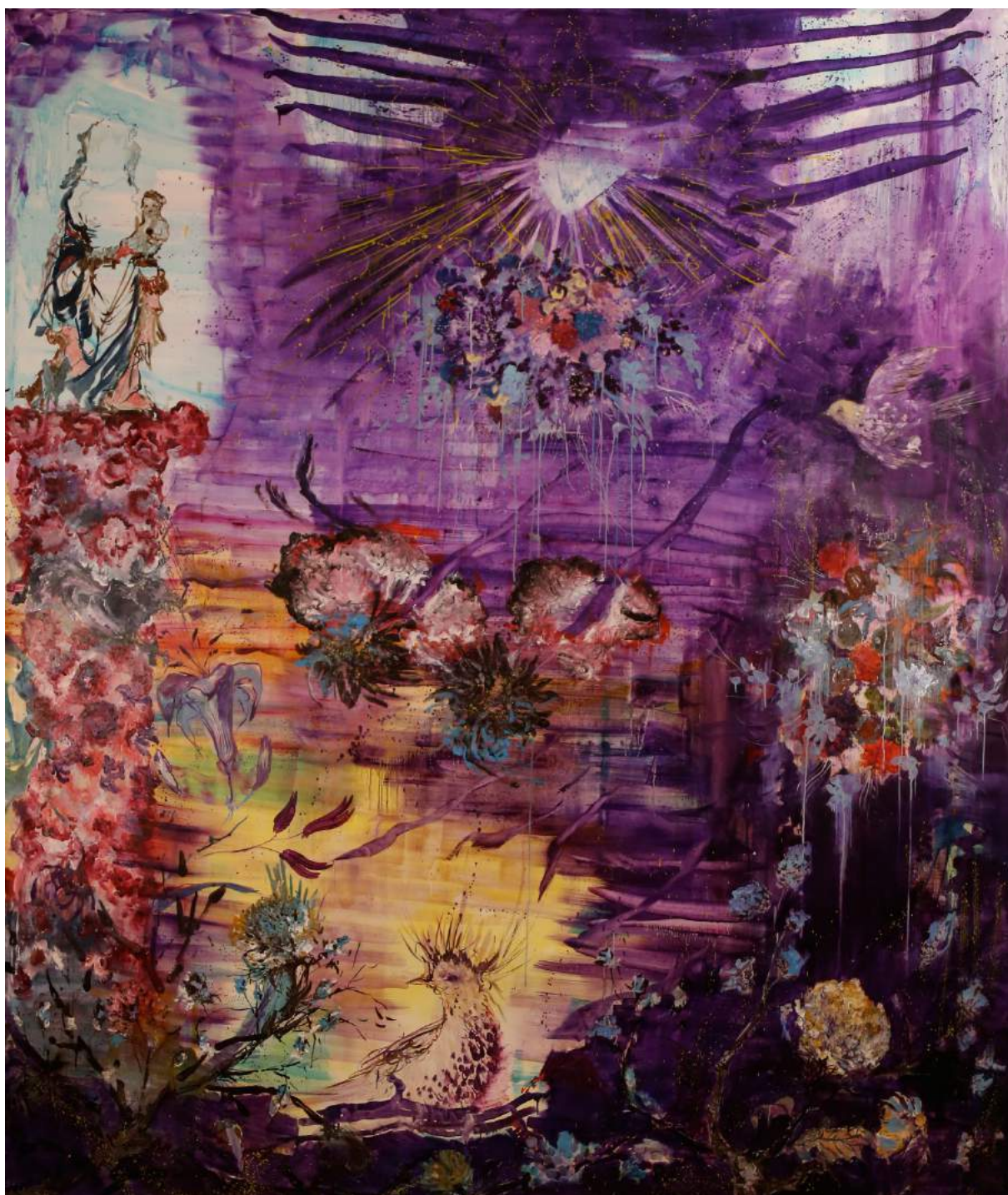
Eclipses, 315 x 270 cm, huile sur toile, 2018