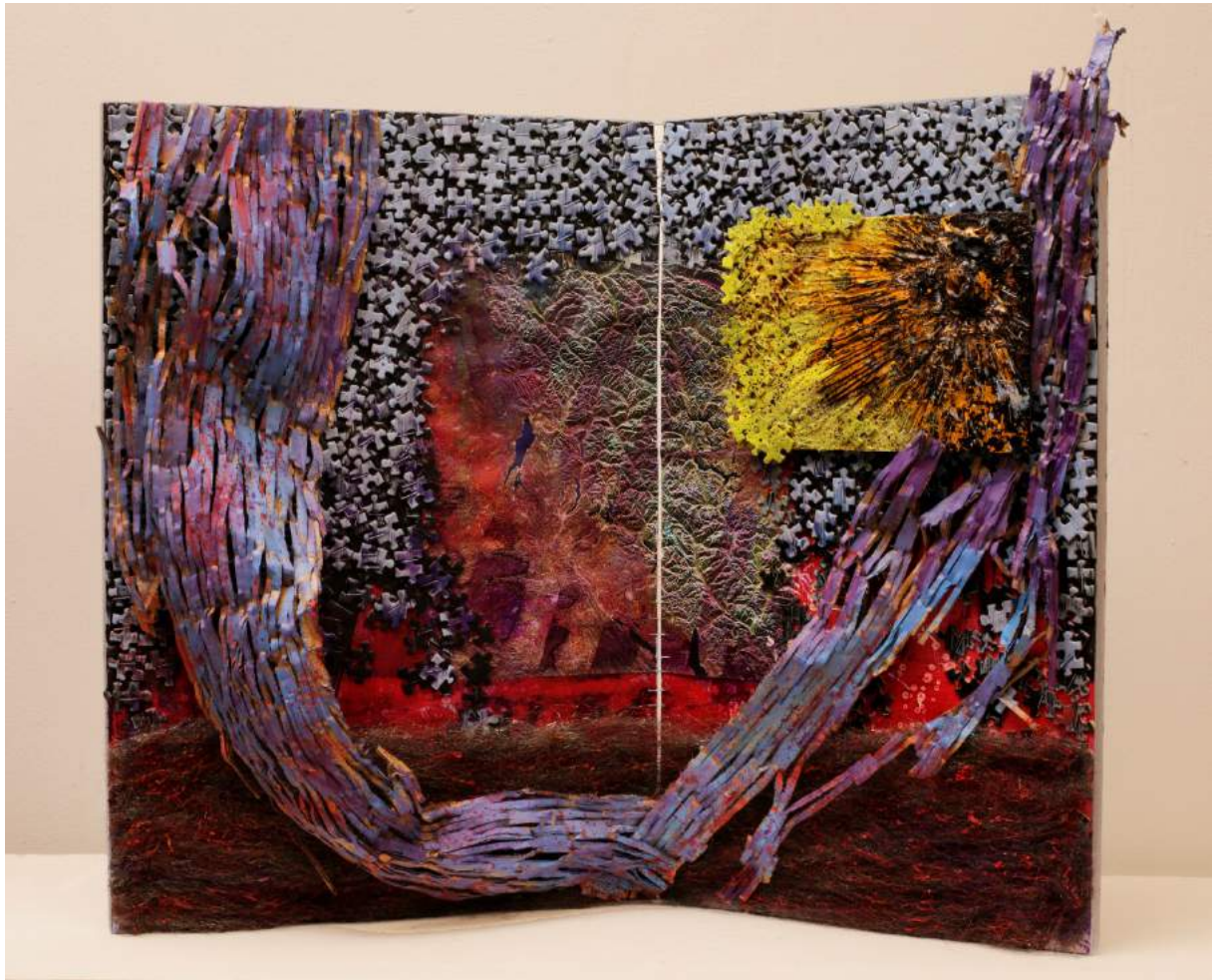
Huile, puzzle et collage sur médium agrafé, 54 x 63.5, 2018